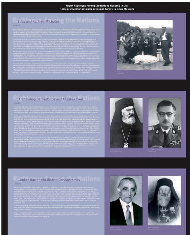
Ύψωση από τον «Τοίχο των Δικαίων» στο Κέντρο Ολοκαυτώματος του Ντιτρόιτ.

Για τα εγκαίνια της έκθεσης και τους «Έλληνες Σωτήρες» δημοσιεύθηκαν αφιερώματα σε ελληνόφωνες εφημερίδες των ΗΠΑ, όπως στη Greek Star of Chicago, την Hellenic Voice of Boston κ.ά.