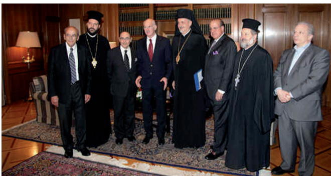
Ο πρωθυπουργός με μέλη των δύο αντιπροσωπειών και τον πρόεδρο του ΚΙΣ

Κατά την έναρξη του Συνεδρίου διαβάστηκαν τα μηνύματα του Οικουμενικού Πατριάρχη Βαρθολομαίου, των Πατριαρχών Αλεξανδρείας Θεόδωρου και Ιεροσολύμων Θεόφιλου, του Αρχιεπισκόπου Αθηνών Ιερώνυμου, καθώς και του πρωθυπουργού κ. Γεω. Παπανδρέου, της υπουργού Παιδείας κας Α. Διαμαντοπούλου και του αναπληρωτή υπουργού Εξωτερικών κ. Δημ.